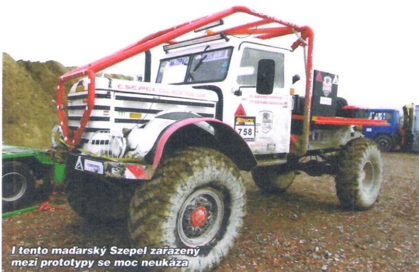
I tento maďarský Szepeľ zařazený mezi prototypy se moc neukáza