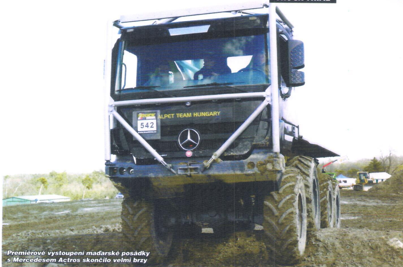
Premiérové vystoupení maďarské posádky s Mercedesem Actros skončilo velmi brzy