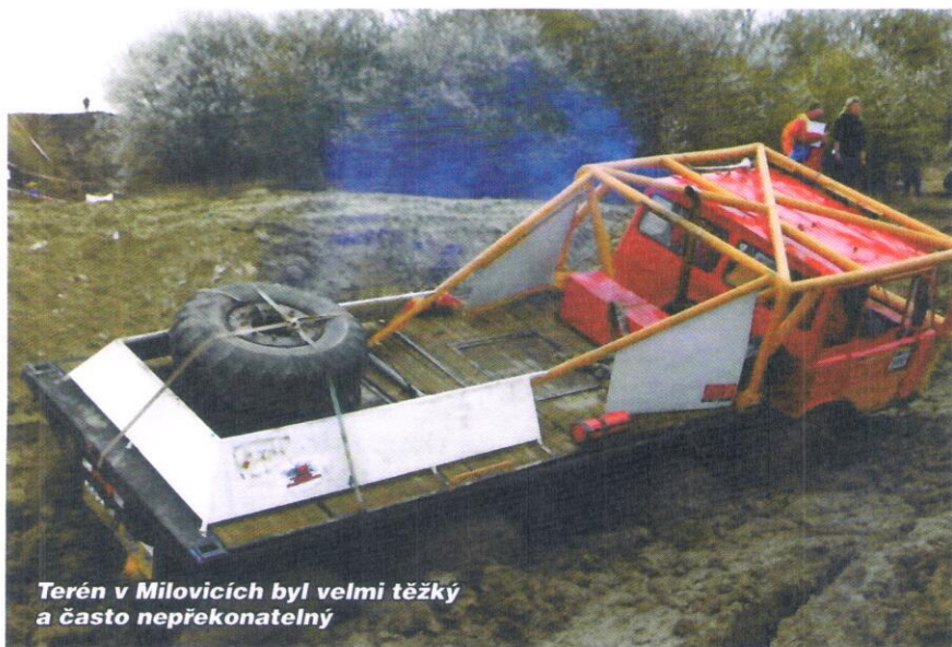
Terén v Milovicích byl velmi těžký a často nepřekonatelný